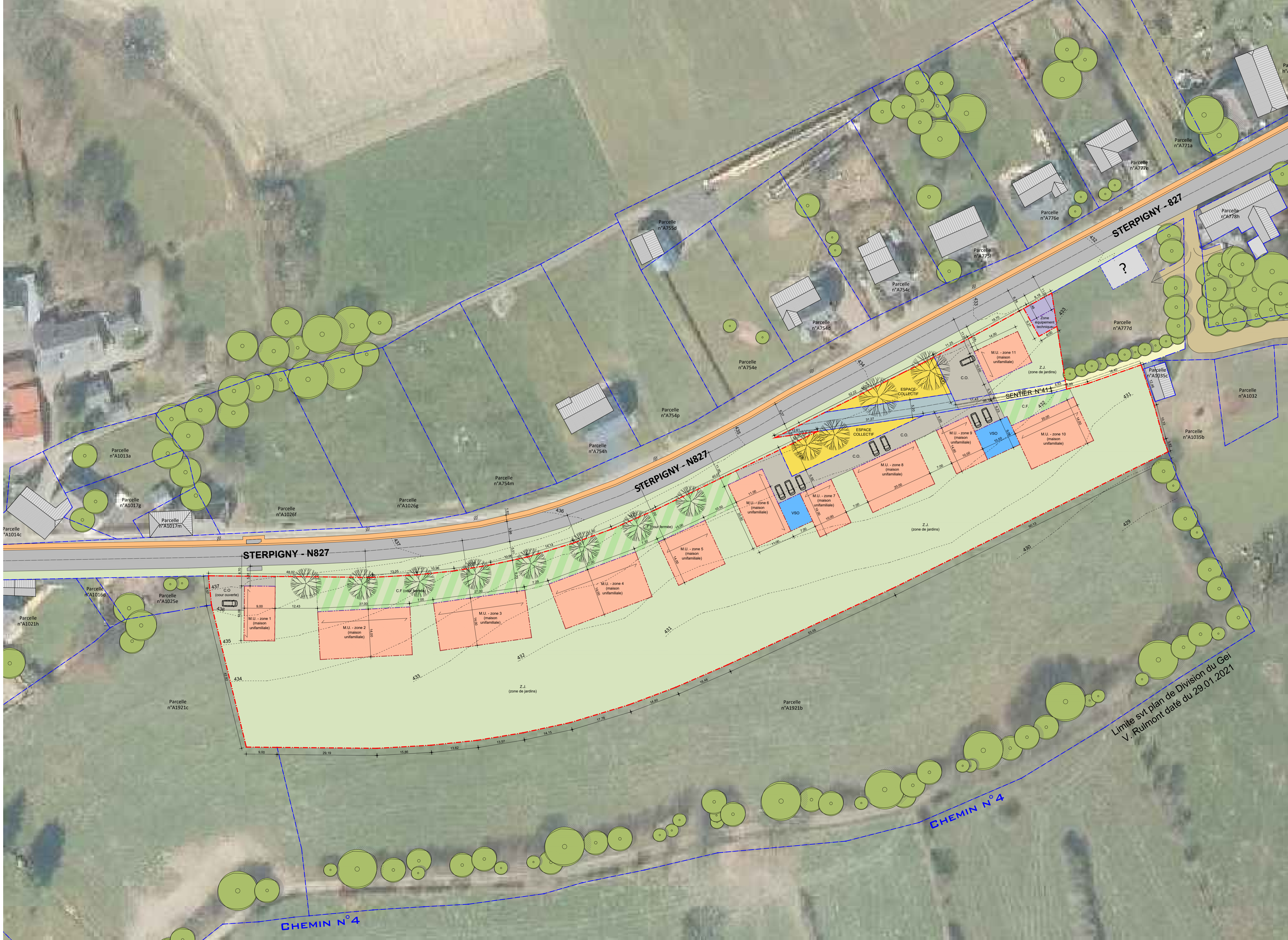
PLAN D'OCCUPATION échelle 1/500 ème